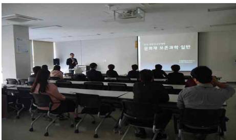
△ '문화재 보존과학 일반' 강의