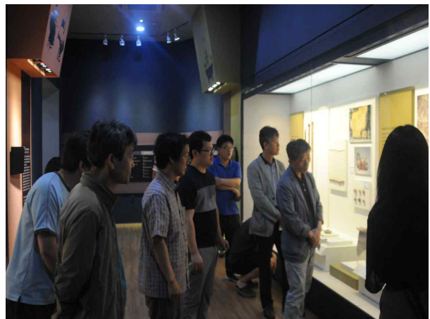
△ ‘전시실’ 단체 관람