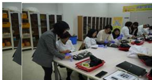
△ '막새기와 접합 및 복원' 실습