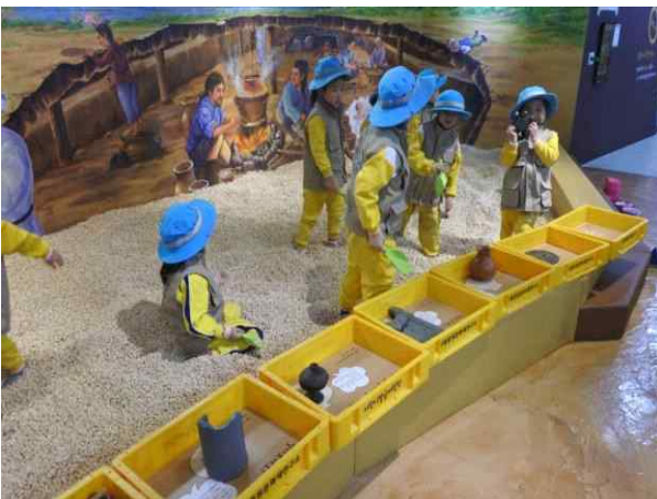
△ ‘어린이 발굴체험장’ 단체 체험